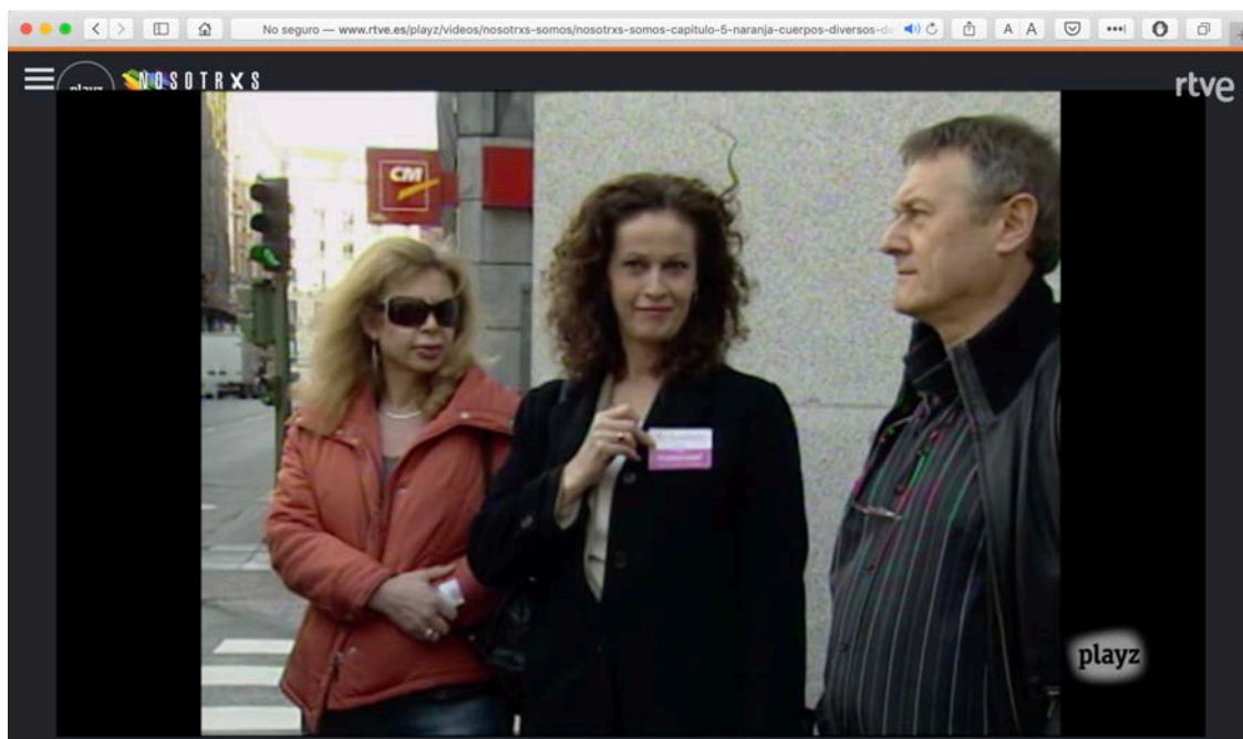
Figura 6. Carla Antonelli en una concentración a favor de la ley integral de transexualidad. 2006. Capítulo 5, 26'12"