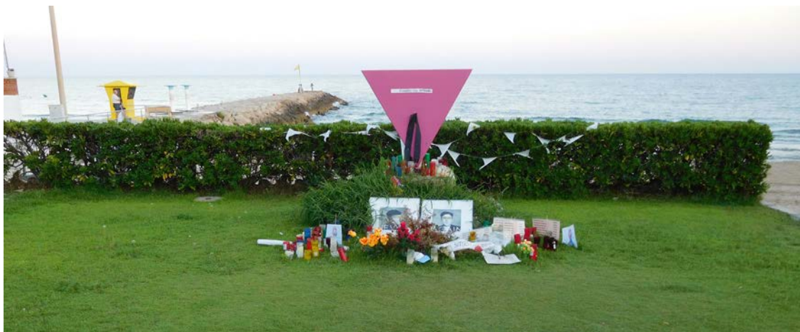
Figura 7. Monumento inaugurado en el paseo marítimo de Sitges en 2006 que recuerda la paliza recibida por un homosexual diez años antes. El triángulo rosa invertido era la insignia que los gays debían lucir en los campos de concentración nazis. En el momento de la fotografía el espacio se colmaba con muestras de cariño por las víctimas del atentado de Orlando, 2016.