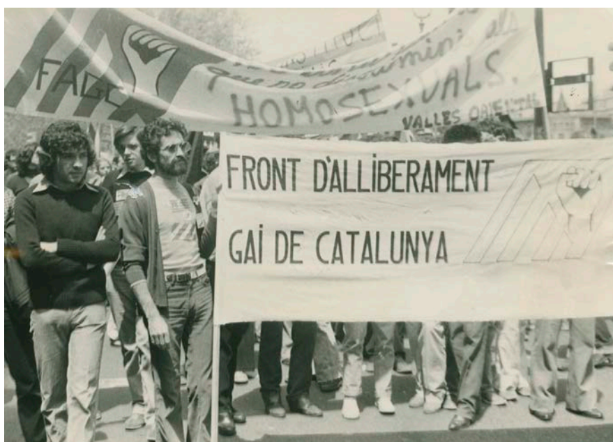
Figura 1. Manifestación en Barcelona, 25 de junio de 1978. Como en el año anterior, convocó el FAGC. También hubo manifestaciones, por primera vez, en Madrid, Sevilla y Valencia.